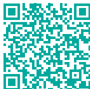
Dokumenty a metodické pokyny